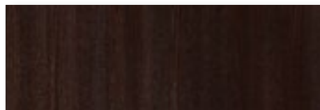
FTM - Frassino tinto Testa di Moro/ Dark Brown stained Ash