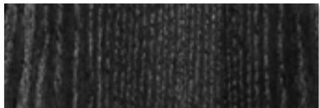
FNR - Frassino tinto Nero/Black stained Ash