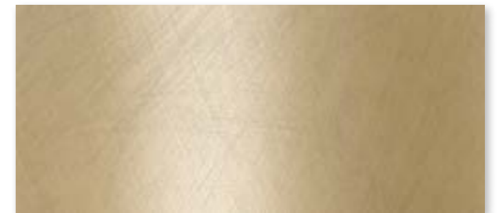
VS6 - Oro spazzolato / Brushed Gold