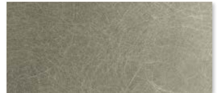
S01 - Platino spazzolato / Brushed Platinum NEW