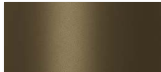
V05 - Bronzo / Bronze